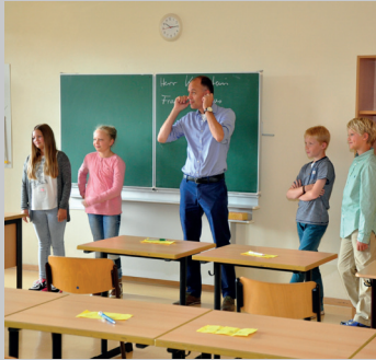
Der erste Schultag an der Elisabethschule