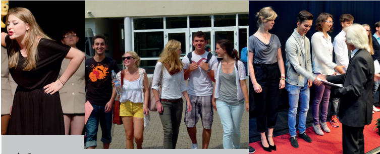
Oberstufenschüler auf dem Heimweg

Seit 2015 verfügt die Elisabethschule über eine Bibliothek für Mittel- und Oberstufe. Die moderne Ausstattung mit Büchern, Zeitschriften und Laptops bietet beste Voraussetzungen für selbstständiges Arbeiten. Vormittags steht jeweils eine Lehrkraft zur Verfügung, die die Schüler/innen beraten und unterstützen kann. Die Bibliothek ist bis 15.30 Uhr geöffnet und kann nach Absprache auch länger genutzt werden.