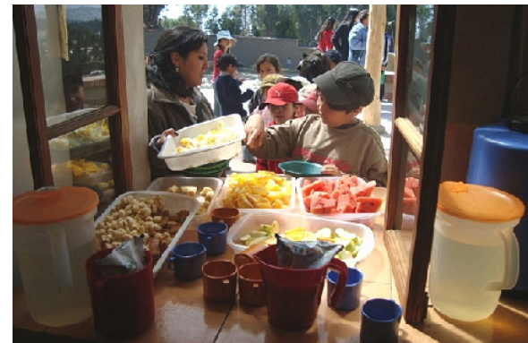
Essensausgabe in der Küche der Kurmi Wasi-Schule

Die Elisabethschule hat die Schule Kurmi Wasi in der Nähe von La Paz/Bolivien in den letzten zehn Jahren mit über 100.000 Euro unterstützt. Mit Hilfe unserer Spenden konnten die Cafeteria, die Schulküche und zuletzt ein Spielplatz fertig gestellt werden. Wir wollen auch weiterhin mit besonderen Aktionstagen und Benefizveranstaltungen dazu beitragen, dass die pädagogische Arbeit fortgeführt und die Schule weiter ausgebaut werden kann.