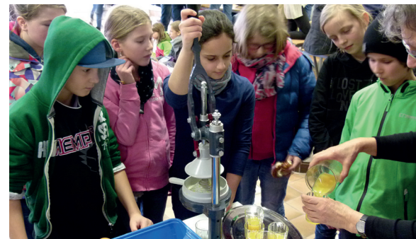
Frisch gepresst: Köstlicher Orangensaft

Ziel des Ganztagsangebots ist es einerseits, zur Entlastung berufstätiger Eltern eine verlässliche Betreuung der jüngeren Schülerinnen und Schüler zu gewährleisten. Andererseits geht es darum, den Schulerfolg durch die regelmäßige Anfertigung von Hausaufgaben sicherzustellen und in Spiel- und Neigungsgruppen Interessen zu wecken, Begabungen zu entdecken und zu entwickeln und nicht zuletzt für das anstrengende Lernen einen attraktiven Ausgleich zu bieten.