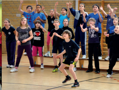
Sport- und Spieletag