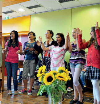
Der Unterstufenchor in Aktion