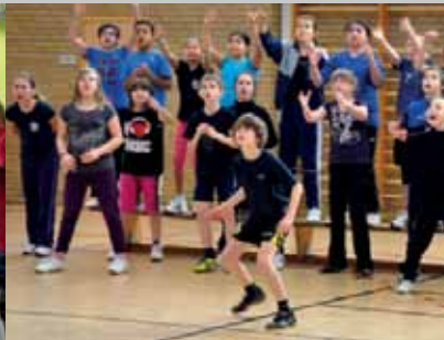
Sport- und Spieletag