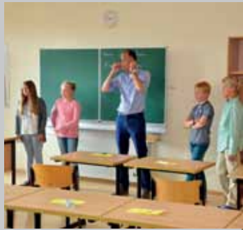
Der erste Schultag an der Elisabethschule