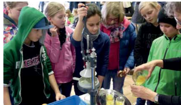
Frisch gepresst: Köstlicher Orangensaft

Ziel des Ganztagsangebots ist es einerseits, zur Entlastung berufstätiger Eltern eine verlässliche Betreuung der jüngeren Schülerinnen und Schüler zu gewährleisten. Andererseits geht es darum, den Schulerfolg durch die regelmäßige Anfertigung von Hausaufgaben sicherzustellen und in Spiel- und Neigungsgruppen Interessen zu wecken, Begabungen zu entdecken und zu entwickeln und nicht zuletzt für das anstrengende Lernen einen attraktiven Ausgleich zu bieten.