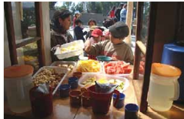
Essensausgabe in der Küche der Kurmi Wasi-Schule

Die Elisabethschule hat die Schule Kurmi Wasi in der Nähe von La Paz/Bolivien in den letzten zehn Jahren mit über 100.000 Euro unterstützt. Mit Hilfe unserer Spenden konnten die Cafeteria, die Schulküche und zuletzt ein Spielplatz fertig gestellt werden. Wir wollen auch weiterhin mit besonderen Aktionstagen und Benefizveranstaltungen dazu beitragen, dass die pädagogische Arbeit fortgeführt und die Schule weiter ausgebaut werden kann.