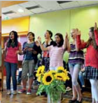
Der Unterstufenchor in Aktion