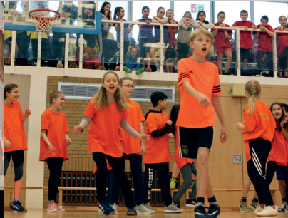
Sport- und Spieletag