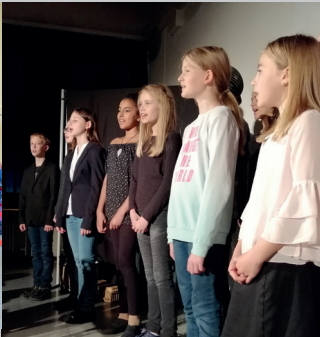
Der Musicalchor tritt auf