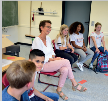
Der erste Schultag an der Elisabethschule