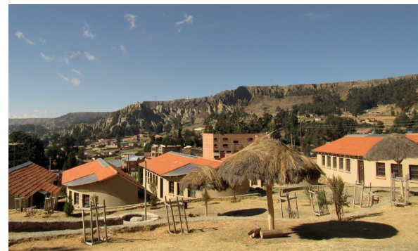
Schulgelände der Kurmi Wasi-Schule in La Paz, Bolivien

Die Elisabethschule hat die Schule Kurmi Wasi in der Nähe von La Paz/Bolivien in den letzten Jahren mit großem Engagement unterstützt. Mit Hilfe unserer Spenden konnten die Cafeteria, die Schulküche und zuletzt ein Spielplatz fertig gestellt werden. Wir wollen auch weiterhin mit besonderen Aktionstagen und Benefizveranstaltungen dazu beitragen, dass die pädagogische Arbeit fortgeführt und die Partnerschule in La Paz weiter ausgebaut werden kann.