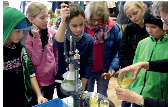
Frisch gepresst: Köstlicher Orangensaft

Ziel des Ganztagsangebots ist es einerseits, zur Entlastung berufstätiger Eltern eine verlässliche Betreuung der jüngeren Schülerinnen und Schüler zu gewährleisten. Andererseits geht es darum, den Schulerfolg durch die regelmäßige Anfertigung von Hausaufgaben sicherzustellen und in Spiel- und Neigungsgruppen Interessen zu wecken, Begabungen zu entdecken und zu entwickeln und nicht zuletzt für das anstrengende Lernen einen attraktiven Ausgleich zu bieten.